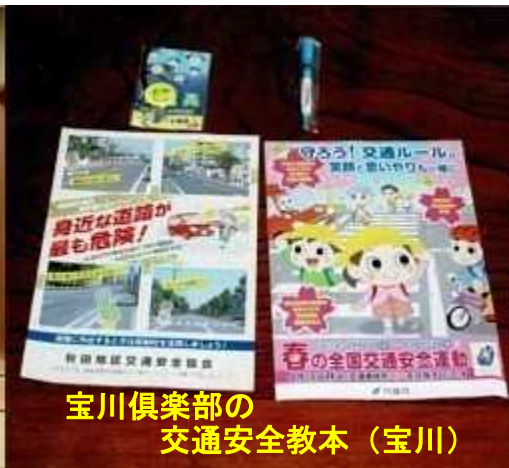
宝川倶楽部の交通安全教本 (宝川)