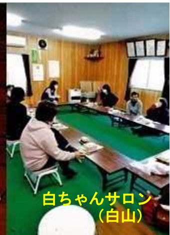
白ちゃんサロン (白山)