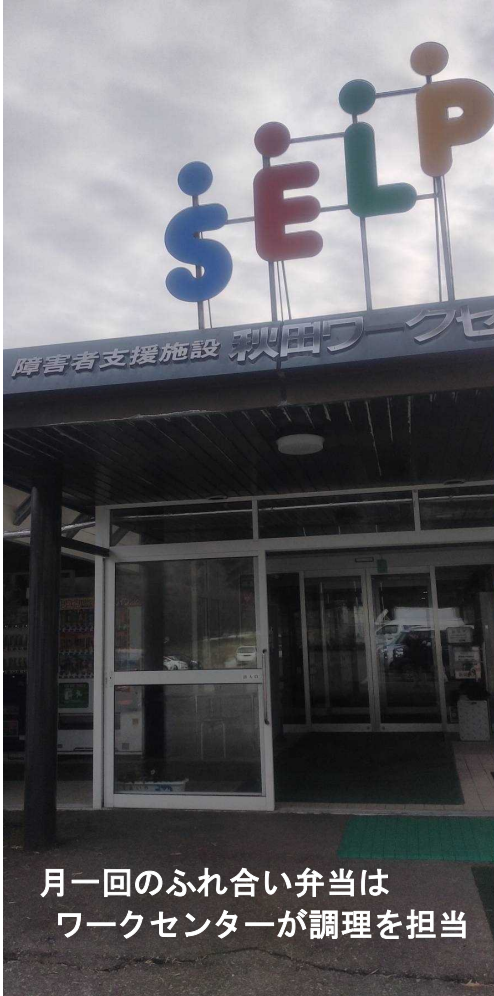
月一回のふれ合い弁当は ワークセンターが調理を担当