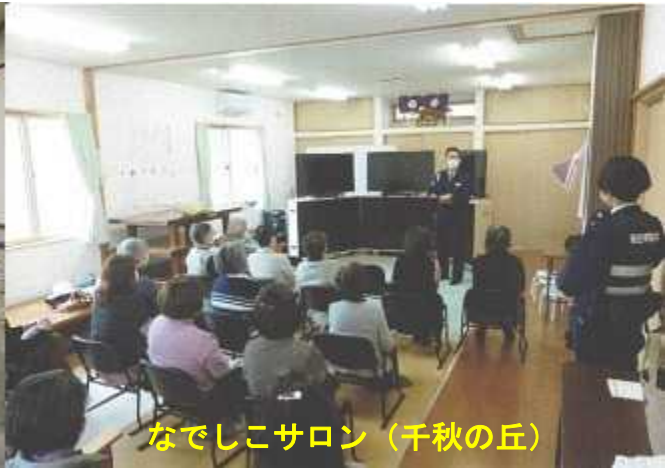
なでしこサロン (千秋の丘)