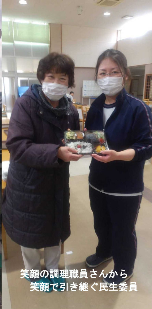
笑顔の調理職員さんから 笑顔で引き継ぐ民生委員