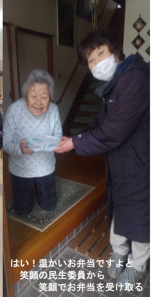
はい！温かいお弁当ですよ 笑顔の民生委員から 笑顔でお弁当を受け取る