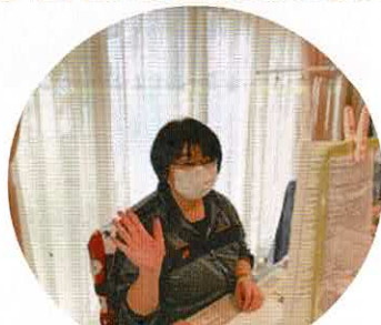
社会福祉士 管理者