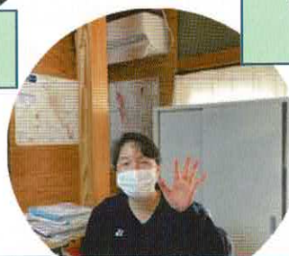
生活支援コーディネーター (看護師)