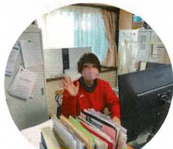
主任ケアマネ (介護福祉士)

「どこにあるの?」「どんな人がいるの?」という方々のために こんな人達(職種)が皆様のご相談の支援を担っています。