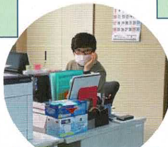
認知症地域推進員 (介護士)