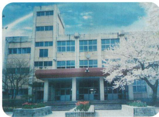
下北手小学校 現校舎