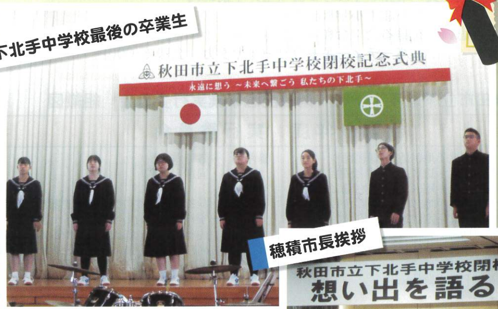
下北手中学校最後の卒業生