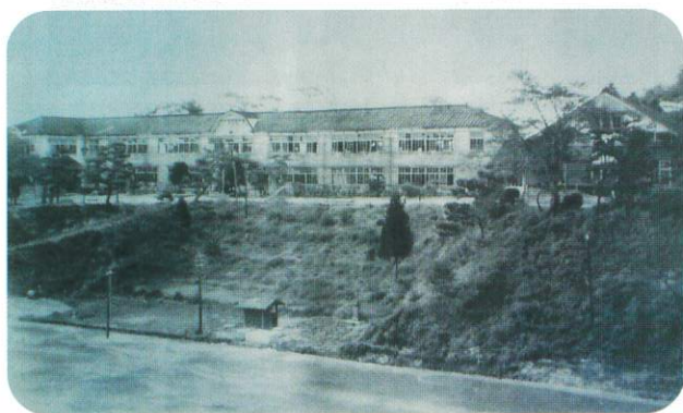
下北手小学校 旧校舎