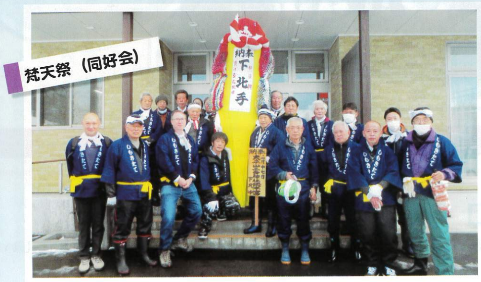
梵天同好会の会員と国際教養大や地域福祉施設の皆様と共に